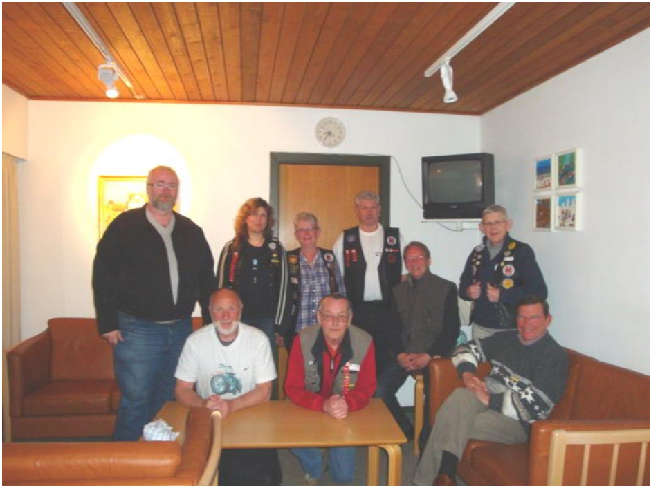
Den nye bestyrelse foreviget efter generalforsamlingen.