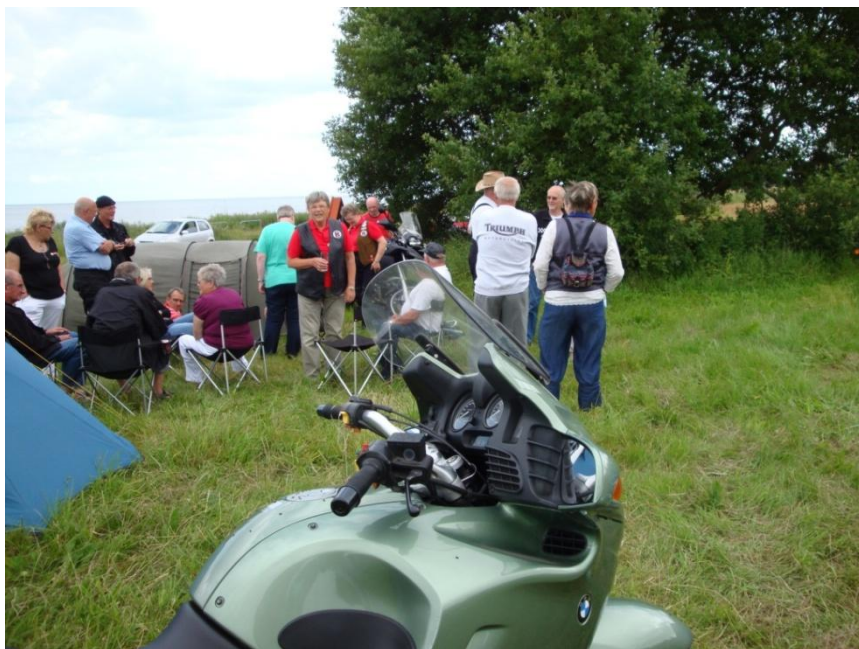
Træfdeltagere ved teltpladsen i Als havbakker.