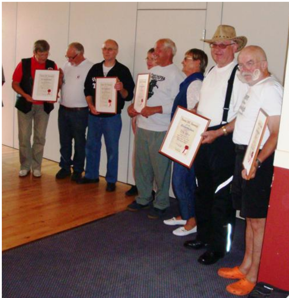
De nyudnævnte æresmedlemmer.

Der vil sikkert i et senere blad blive skrevet lidt mere om begivenheden.