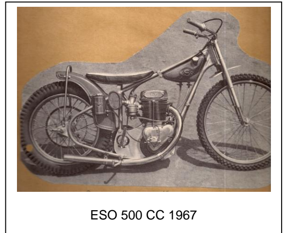
ESO 500 CC 1967