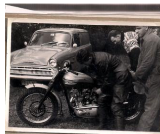
Trophy TR 500