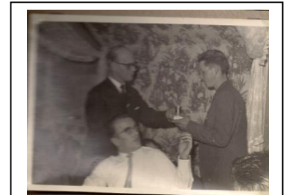
Pokal Trial 1958