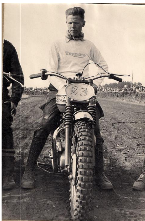
Sinding April 1961