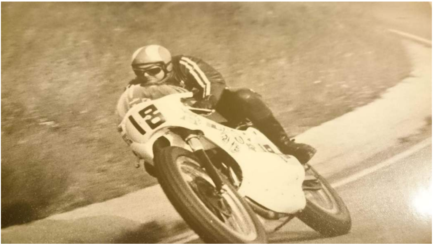
Nedenfor præmier og tider fra Road Racing tiden